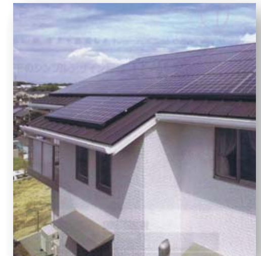
太陽電池設置事例

※( )の部分についてはご相談ください。 ※在庫色についてはお問い合わせください。